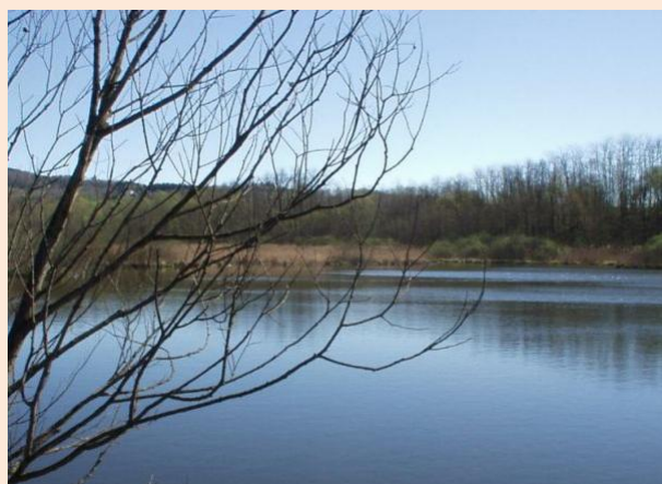
L'Oasi della torbiera del Bassone

a cura del Museo Civico e dell'Associazione Ecologica La Puska di Lentate sul Seveso