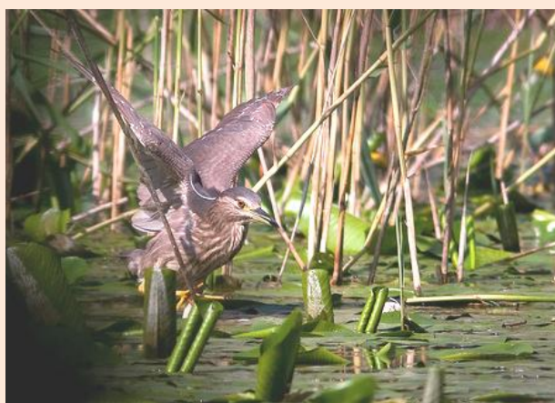
Una nitticora al Bassone