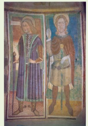
Gli affreschi di S. Adriano

Assicurazioni a carico dei partecipanti.