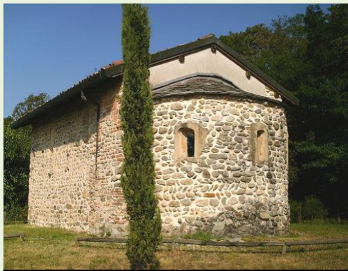
La chiesetta di S. Adriano a Olgelasca

- info@prolococarugo.it tel. 380 7231190 www.prolococarugo.it