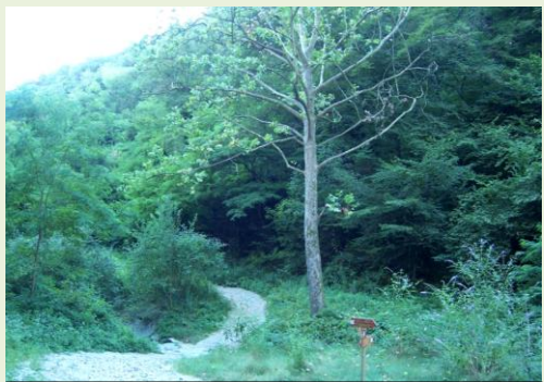
La valle di Brenna