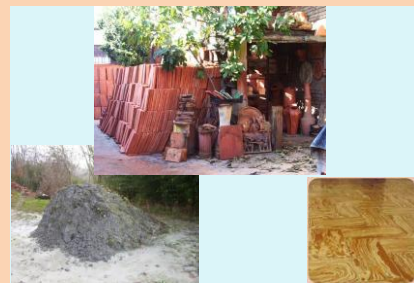
La Fornace artistica Riva