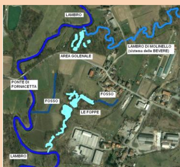
Le Foppe di Fornacetta