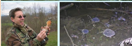
Le Foppe di Fornacetta: un'area pregiata