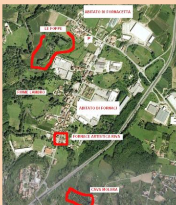
Le aree da visitare

la mattina di domenica chiamare i numeri sopra indicati per accertarsi se l'uscita è annullata.