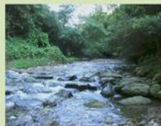
Immagini della valle del torrente Serenza e dei prati circostanti

In caso di maltempo, la mattina di domenica, chiamare al n° di telefono sopra indicato per accertarsi se viene annullata l'uscita.