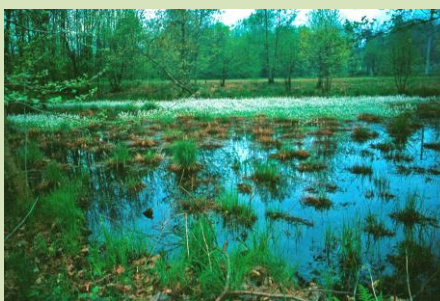
Stagno Lieti fiorito