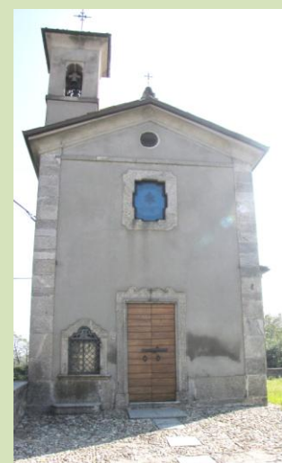
Chiesetta di Verdegò